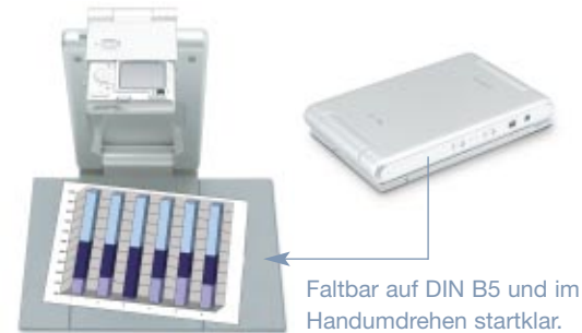
Faltbar auf DIN B5 und im Handumdrehen startklar.

Sie kennen das: Während des Meetings werden noch schnell aktuelle Informationen nachgereicht. Natürlich nicht in digitaler Form sondern als handschriftliche Notizen, als Ausdruck oder Zeitungsausschnitt. Wäre es nicht schön, wenn Sie in der Lage wären, diese Vorlagen umgehend und hochauflösend in Ihre Projektor-Präsentation mit einzubinden? Mit dem YC-400 ist das ab sofort kein Problem mehr: Einfach auf den Vorlagenhalter legen und auslösen. Die mitgelieferte PC-Software lädt das Foto automatisch in Ihren PC, erkennt schief eingelegte Vorlagen, richtet sie im rechten Winkel aus und sichert die Daten.